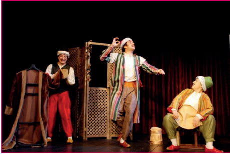
Tiyatro sahnesinde sergilenen oyun